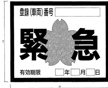
別記様式第7(第6条の2関係)